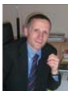
Entretien avec Boris BERNABEU Sous-Préfet de Florac