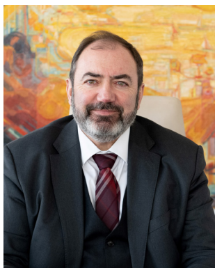
François BRAUN Ministre de la Santé et de la Prévention

Depuis près d'un an d'action au service des Français, nous avons conforté notre conviction que face aux difficultés d'accès aux soins, les réponses doivent être partagées, pragmatiques et adaptées à la réalité de chaque territoire. Une politique de santé ne se décide pas depuis Paris, elle se construit avec les territoires, en prenant compte de leurs spécificités.