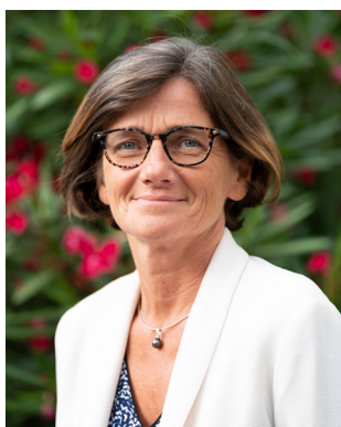
Agnès FIRMIN LE BODO Ministre déléguée chargée de l'Organisation territoriale et des Professions de santé

Cette nouvelle méthode, en partant du terrain, pour les territoires et avec les professionnels de santé, elle illustre notamment au travers du Conseil national de la refondation en santé dont nous avons annoncé les premières conclusions le 3 mai au ministère de la Santé et de la Prévention. Elle s'est traduite aussi avec les annonces de la Première ministre le 15 juin dernier lors du lancement de France Ruralités. Elle se décline aujourd'hui avec une série de mesures très concrètes pour permettre aux professionnels de santé de retrouver du temps de soins, d'améliorer leurs pratiques et, in fine , d'accroître l'offre de soins disponible pour les patients.