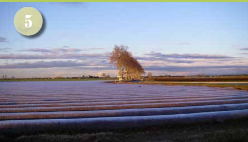
LES CONTREFORTS DES CAUSSES ET DE LA MONTAGNE NOIRE