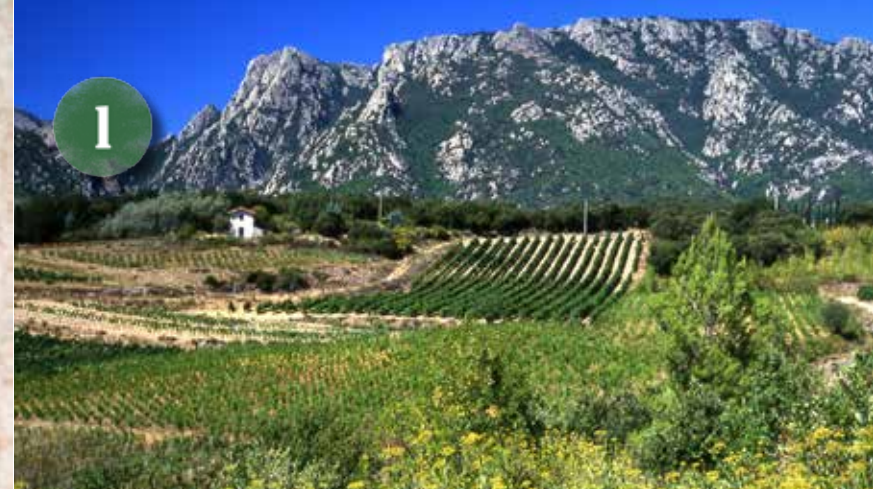
BORDURE MÉRIDIONALE DE LA MONTAGNE NOIRE