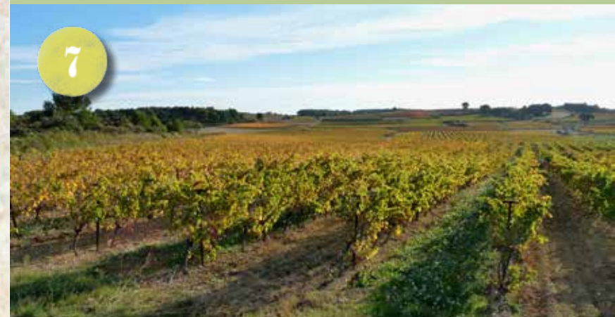
LES COLLINES DU BITERROIS ET DE L'HÉRAULT